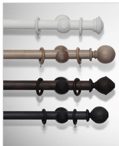
Ebaniste Ø35 mm

Gardinstengene måltilpasses i nøyaktige lengder fra 40 cm til 420 cm, og monteres på vegg ved bruk av veggholdere. Velg blant ulike spyd som dekorelement i hver ende av stangen, der lengden på endedekoren kommer i tillegg til stanglengden.