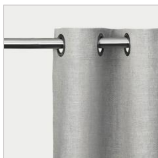
Modell 6 Maljegardin