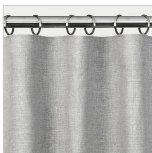
Modell 2 Wavefold