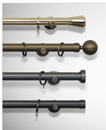
Madison Ø 30 mm