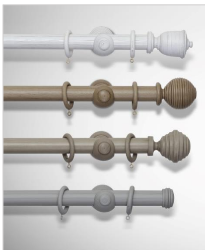
Wood Ø35 mm