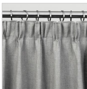
Modell 3 Viftefold