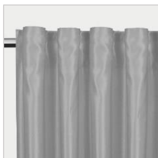
Modell 5 Stangbånd