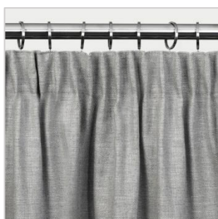
Modell 1 Blyantfold

Modell 1-4 henges opp ved bruk av gardinringer som leveres i riktig antall i forhold til stanglengden og foldtype. Modell 5-6 tres inn på stangen gjennom et stangbånd eller påsatte stålmaljer.