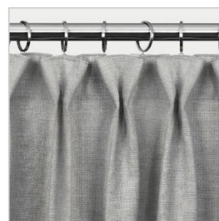
Modell 4 Gruppefold