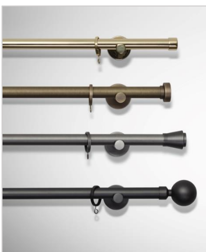
Madison Ø 20 mm

Kolleksjonen av Madison metallstenger består av tøffe, måltilpassede gardinstenger i trendy metallfarger, inspirert av den industrielle stilen som oppsto i New York på 90 tallet. Gardinstenger leveres i to valgfri tykkelser på stangen (Ø20 mm og Ø30 mm) og i fire tidsriktige farger; gunmetal, matt graphite, antikk bronse og blank messing.