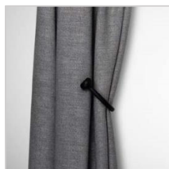
Gardinholder i smijern

Ved lengder over 200 cm leveres tre veggholdere, der den tredje er en midtholder. Stanglengder over 200 cm skjøtes på midten med et innvendig skjøtebeslag, der skjøten plasseres i midtholderen.