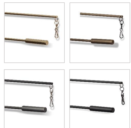
Madison førerstenger, 100 cm