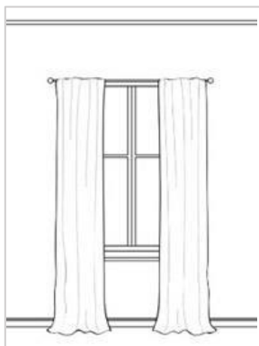
Vinduet virker smalere og lite dagslys slippes inn i rommet

Tradisjonelt monteres gardinstenger ca 8 cm fra overkant av vinduet, der stangen går 15 cm ut på hver side av vinduskarmen, med tillegg av endedekor. I den senere tid er det blitt mer vanlig å tenke at gardinstenger med fordel kan med fordel monteres i en høyde langt over øvre karm, for å gi inntrykk av mer takhøyde, og i en stanglengde som går minst 20-25 cm ut på hver side av vinduet, slik at mesteparten av gardinhøyden parkeres og henges utenfor selve vindusåpningen. På den måten virker vinduet større, samtidig som det slippes inn mest mulig lys.