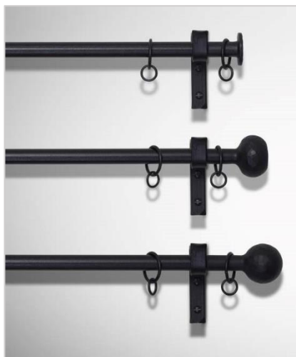
Smijern Ø20 mm

Merk; Gardinstangen leveres kun i faste lengder fra 40 cm til 400 cm . Velg den stanglengden som best passer til vinduet, da lengden ikke kan kappes ned. En kort stang på 40 cm benyttes gjerne til oppheng av dekorative sidegardiner. Smijern-stangen er massiv og har åpning i enden for innfesting av endedekor, der endestykket også har en stangdel på 5 cm som kommer i tillegg på hver side.