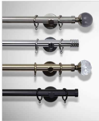
Lux Ø29 mm

Gardinstengene måltilpasses i nøyaktige lengder fra 40 cm til 420 cm, og monteres på vegg ved bruk av veggholdere. Du kan velge ulike spyd som dekorelement i hver ende av stangen, som leveres i samme farge. Lengden på endedekoren kommer i tillegg til stanglengden.