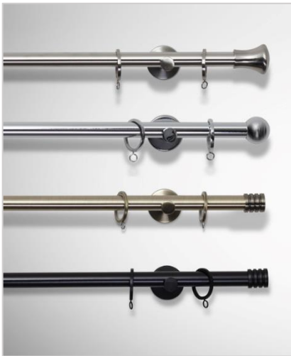
Lux Ø19 mm