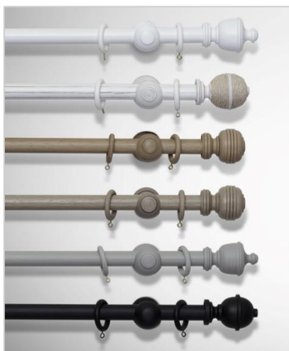
Wood Ø28 mm

Gardinstenger i tre utførelse leveres i to valgfri tykkelser på stangen (Ø28 mm og Ø35 mm), og i et stort utvalg farger og finisher. Stangen og annet tilbehør inklusive veggholdere, endedekor og eventuelt ringer leveres i den samme, matchende farge.